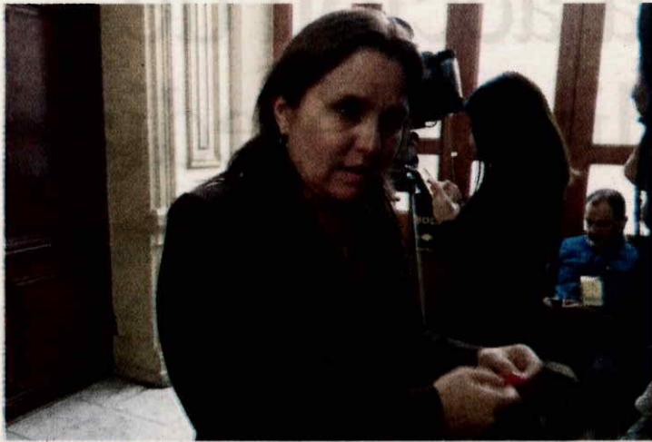
Avanzan las investigaciones y el nerviosismo también.

La presidenta de la comisión Belaunde Lossio, Marisol Pérez Tello, exhortó a César Acuña a no ofenderse si es citado a este grupo de trabajo para que explique su relación con el cuestionado empresario, luego que se revelara que su universidad, César Vallejo, depositó hasta 21 mil dólares a una cuenta bancaria. "En el caso del señor Acuña, que ha sido presidente regional y alcalde, hay una implicancia que él tiene que asumir como personaje público, que es el costo de todos los políticos, que él tiene que asumirlo estóticamente, sin ofenderse", indicó.